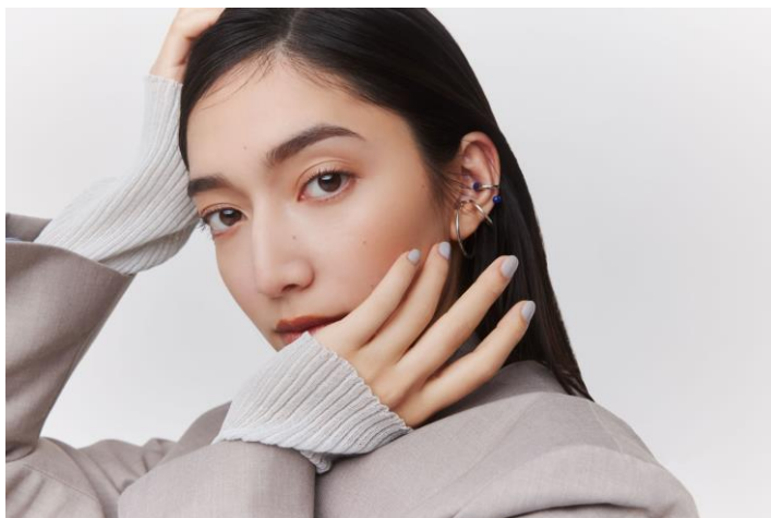
モデル使用色:サナ ニューボーン パーフェクトアイブロウ 03

一人一人の“正解アイブロウ”を毎日誕生させたいという想いでリブランディングした『サナ ニューボーン』。眉メイクに自信のない方もテクニック要らずで思いのままの眉を描ける、25年の歳月を経て作り上げた自信作です。