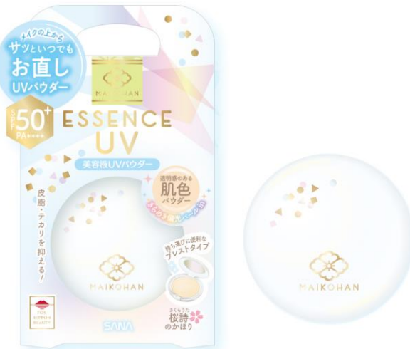
サナ 舞妓はん 美容液UVプレストパウダー 13g 1,500円(税抜)