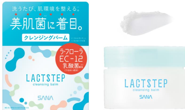
サナ ラクトステップ クレンジングバーム 95g 1,800円(税込1,980円)

クレンジング後のお肌をすこやかに保つじゅわ落ち処方を採用。こすらなくてもメイク・汚れ落ち抜群のとろけるバームで、毛穴の奥まですっきり。お肌に必要なうるおいはしっかり留まり、洗顔後もうるおいをキープします。これ1つで毛穴*9・角質*9・くすみ*9・うるおい不足・黒ずみ*9の5ケアが完了。W洗顔不要でまつ毛エクステンションもOK。スパチュラ付きで衛生的です。