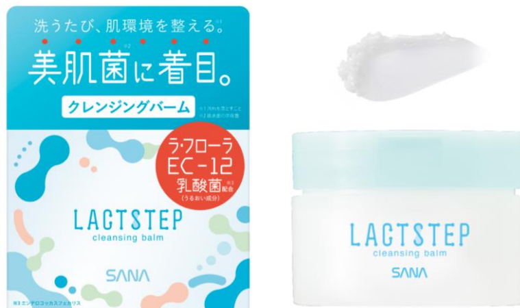
サナ ラクトステップ クレンジングバーム 95g 1,800円(税込1,980円)

クレンジング後のお肌をすこやかに保つじゅわ落ち処方を採用。こすらなくてもメイク・汚れ落ち抜群のとろけるバームで、毛穴の奥まですっきり。お肌に必要なうるおいはしっかり留まり、洗顔後もうるおいをキープします。これ1つで毛穴*9・角質*9・くすみ*9・うるおい不足・黒ずみ*9の5ケアが完了。W洗顔不要でまつ毛エクステンションもOK。スパチュラ付きで衛生的です。