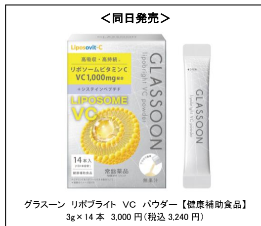
グラスーン リポブライト VC パウダー【健康補助食品】 3g×14本 3,000円(税込3,240円)

スキンケアとして、肌なじみがよくべたつかないテクスチャーで肌悩みにアプローチする濃密集中美容液「グルタブライト VC コンデンスドロップ」と、密着感のあるテクスチャーでハリのあるお肌に導く濃厚密着クリーム「グルタブライト VC リフトンクリーム」を発売いたします。