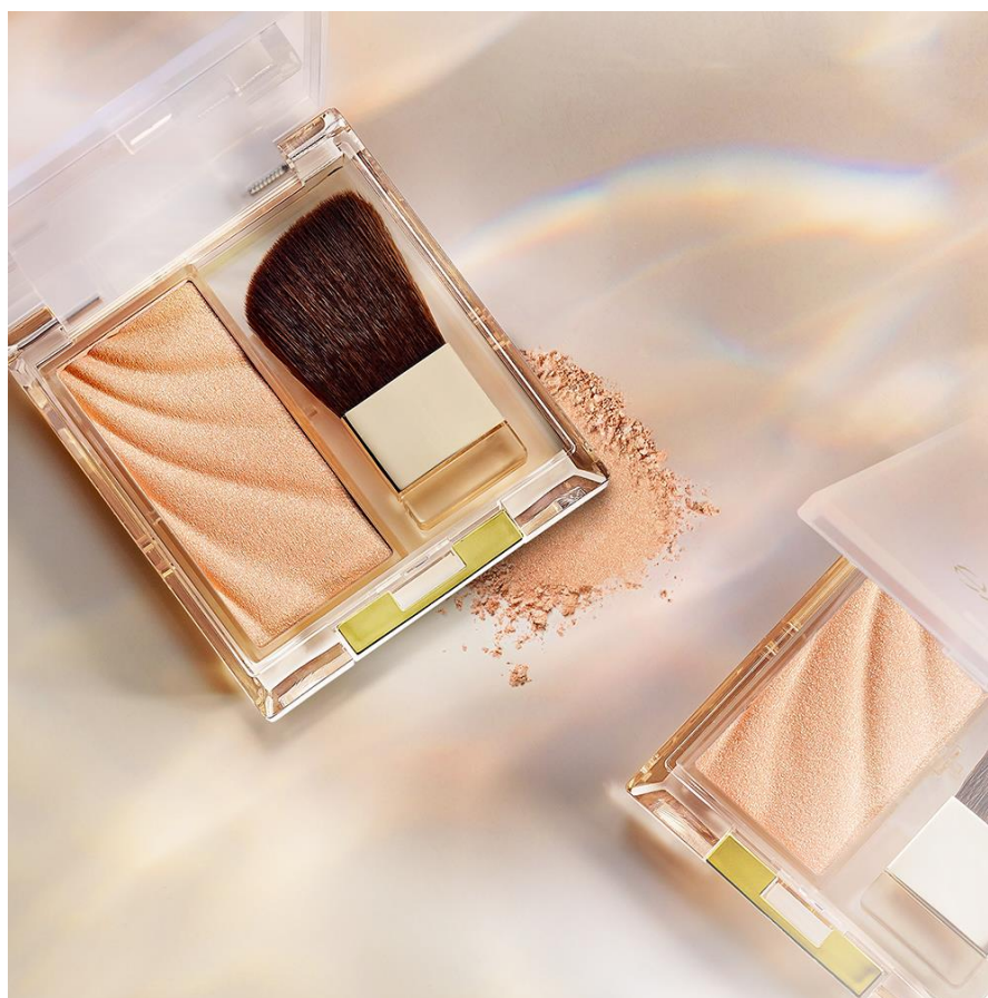
サナ エクセル ドレープド シマーグロウ DS03 1,600円(税込1,760円)

2021年10月の発売直後よりご好評をいただきました既存品2色に続く、この度の新色「ブロンズグロウ」は肌なじみよく自然なメリハリが叶うカラー。じんわり熱を帯びたようなヘルシー肌に仕上がります。