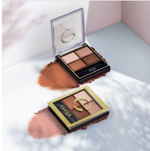
サナ エクセル スキニーリッチシャドウ SR12(デニッシュブラウン) 1,500円(税込1,650円)

このたび発売となる限定色は、ピンクとオレンジという異なる色相を重ねつつ自然なグラデーションを演出する、春らしい軽やかなパレット。心躍る上品なニュアンスカラーで華やかな目元に仕上げます。