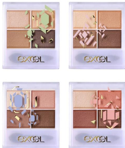
エクセル スキニーリッチシャドウ ('23) SR01(左上)・SR03(右上)・SR06(左下)・SR11(右下)