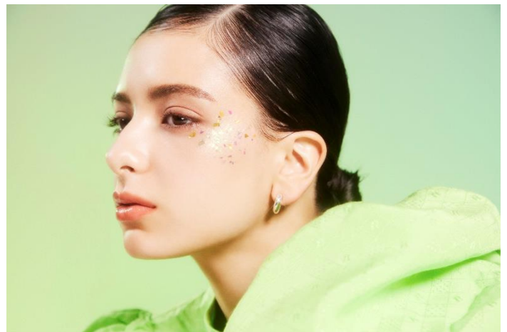
モデル使用色 エクセル スキニーリッチシャドウ SR06、 エクセル パウダー&ベンシル アイブロウEX PD07