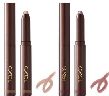
(写真左から) サナ エクセル グリムオンフィットシャドウ GF13・GF14 1,200円(税込 1,320円)