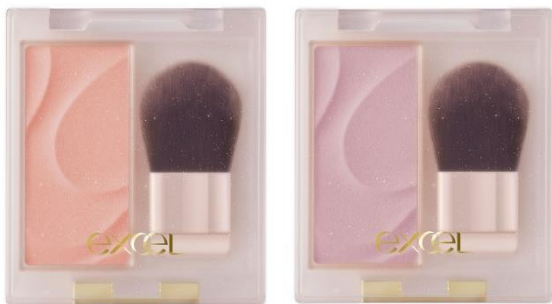
(左から:エクセル シームストーン ブラッシュ SB05・SB06)