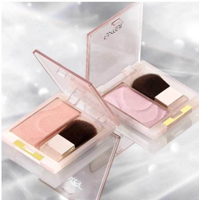
(写真左から) サナ エクセル シームレストーン ブラッシュ SB05・SB06

同日発売の、なめらかで高密着なスティックアイシャドウ「エクセル グリムオンフィットシャドウ」の限定色と合わせてホリデーシーズンに心躍るようなアイテムをお届けします。限定色だけのパールが光るパッケージにもご注目ください。