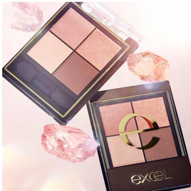
サナ エクセル リアルクローズシャドウ CX08 (クオーツリング)

同日発売の「エクセル ネイルポリッシュ N NL51~NL53」も天然石をモチーフにした限定コレクション。合わせ使いにぴったりのカラーリングで、夏の目元と指先をきらめきで彩ります。