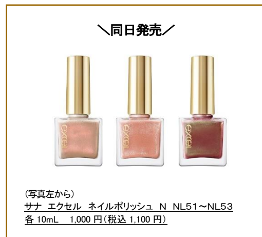
（写真左から） サナ エクセル ネイルポリッシュ N NL51~NL53 各 10mL 1,000円(税込1,100円)