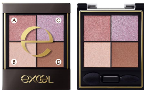
(画像: エクセル リアルクローズシャドウ CX03)