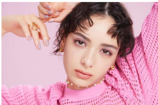
(モデル使用色左から: エクセル リアルクローズシャドウ CX03、CX05)