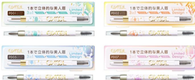
エクセル パウダー&ペンシル アイブロウEX ('23) PD01(左上)・PD02(右上)・PD05(左下)・PD07(右下)