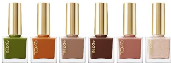
(左から エクセル ネイルポリッシュ N NL35~NL40)