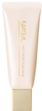
(エクセル モチベートユアスキン)