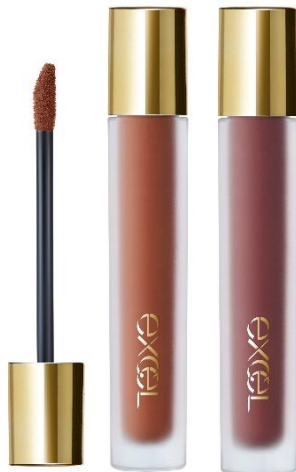
(左から:エクセル リップベルベティスト LV09・LV10)