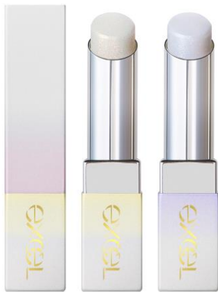
(左からエクセル グロウプリズム GP01、GP02)