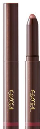
(写真: エクセル グリーンオンフィットシャドウ GF06)