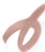
GF09 ランプシェード 優しくまるやかなローズブラウン