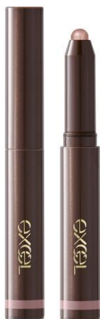
(写真: エクセル グリーンオンフィットシャドウ GF09)