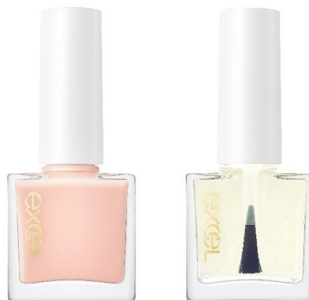
(写真左から) エクセル ネイルリペアプライマー エクセル ファスト&グロウコート