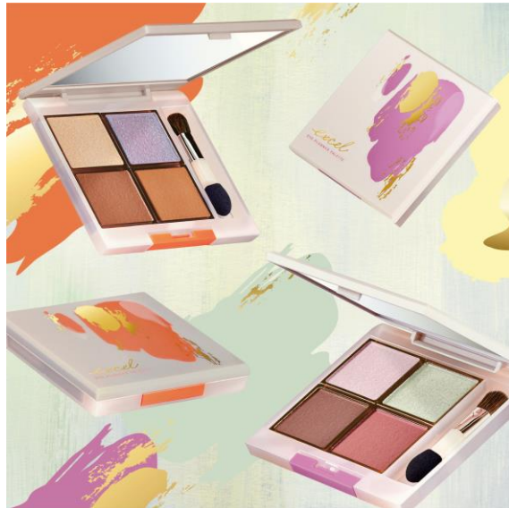
(写真上から) サナ エクセル アイプランナーパレット 01 ('23)・同 02 ('23) 各2,500円(税込2,750円)

お好みに合わせて使い分けられるオリジナルチップ&ブラシを採用。パーティーの華やかさを想起させる、カジュアルアートをあしらった開放感あふれるポジティブなデザインに仕上がっています。