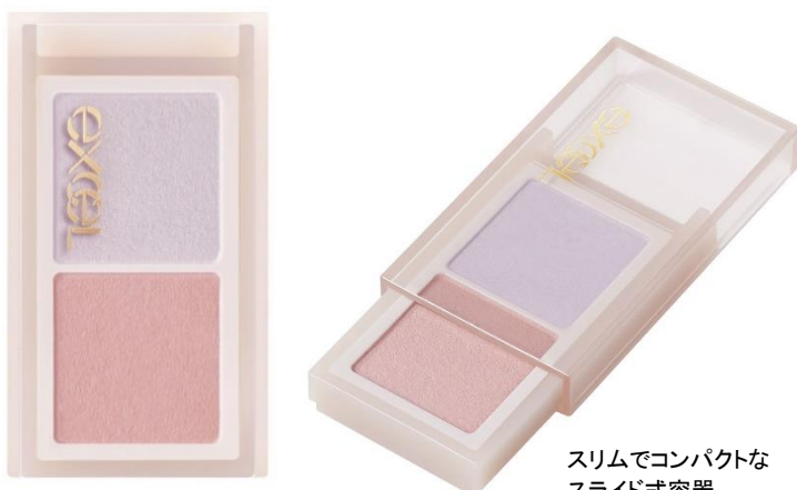
スリムでコンパクトな スライド式容器