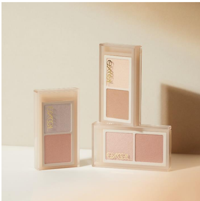
サナ エクセル アイニュアンサー

カラーラインアップはなりたい印象に合わせて選べる3色展開。「EN01(パールマロウ)」は透明感を、「EN02(ファジーコットン)」は陰影感をプラス。「EN03(サイレントポピー)」は血色感を与え、くすみが気になる方におすすめです。いずれもまぶたに溶け込むソフトマットな水彩発色で、すっぴんを自然に盛りたい時やメイク全体のバランスを調整したい時にぜひご使用いただきたいアイテムです。