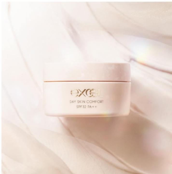
サナ エクセル デイスキンコンフォート 43g 2,100円(税込2,310円)

心やわらぐベルガモット&ユーカリの香り。オールシーズンご使用いただける、1日の始まりにぴったりの晴れやかなスキンケアタイムを過ごせる1品です。