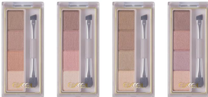
(写真:エクセル カラーエディットパウダーブロウ EP01~EP04)