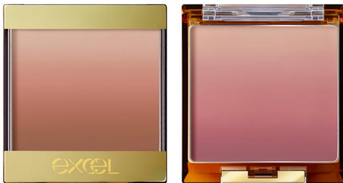
(写真左から:エクセル オーラティック ブラッシュ AB06、AB07)