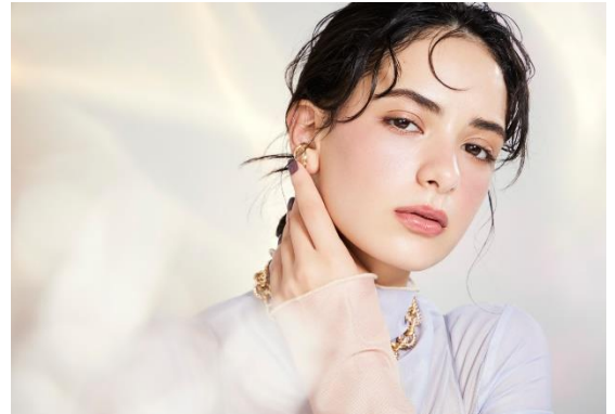
(モデル使用色: エクセル オーラティック ブラッシュ AB09)