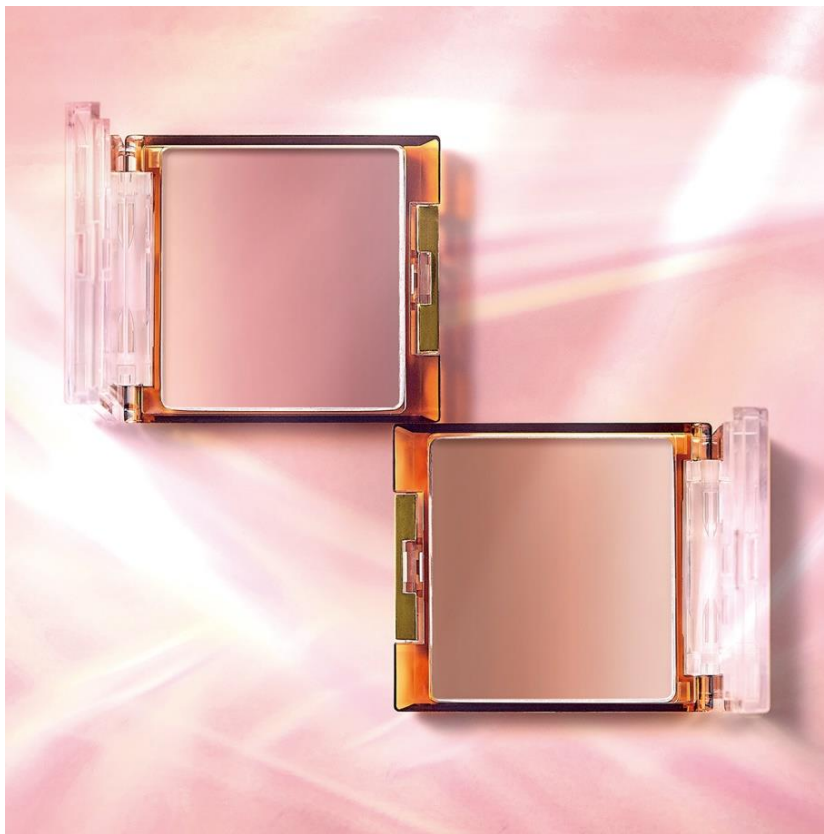
サナ エクセル オーラティック ブラッシュ AB08・AB09 各1,800円(税込1,980円)

上段のハイライトカラーには偏光パールを配合。3色を混ぜ合わせることで、パールとカラーが溶け合い繊細で美しい仕上がり。頬の高い位置に重ね付けすることや、鼻筋やおでこなどに部分的にハイライトのように入れる使い方も◎。ひと塗りで美発色が叶うので、チークを主役としたカラーメイクや、ニュアンスの異なるカラーの重なりを楽しみたい方には是非選んでいただきたいチークです。