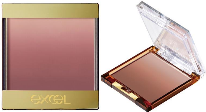
(写真: エクセル オーラティック ブラッシュ AB08, 09)